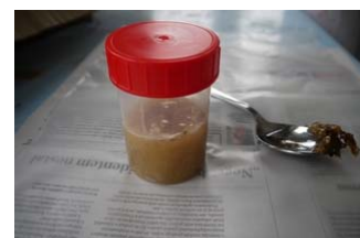
hotovo a ještě označit

Nádoby se označují nalepením vyplněné předtištěné etikety a odevzdají do laboratoře. Pozor! Nutné je datum narození pro nárok na dotaci. Vyšetření směsného vzorku stojí 450 Kč, z toho včelař se podílí 50 Kč.